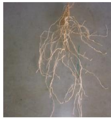
الف) آبیاری کامل