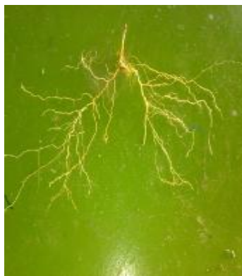
ب) آبیاری PRD با تیغه