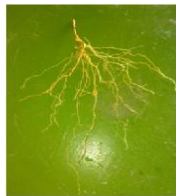
الف) آبیاری کامل