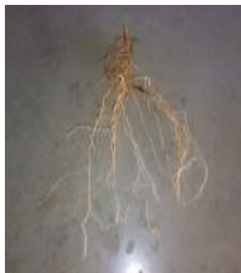
ج) آبیاری بدون PRD بدون تیغه