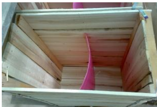
شکل ۱. جعبه چوبی و تیغه وسط آن برای آزمایش PRD