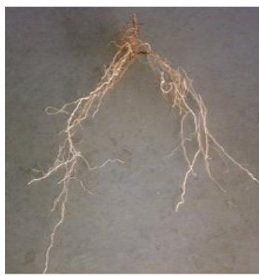
ب) آبیاری PRD با تیغه