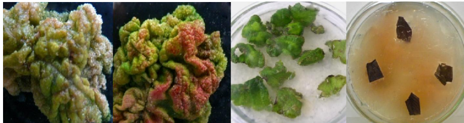
شکل ۲. (A) ترشحات فنولی آزاد شده از برگ‌های گلخانه‌ای پس از ۲۴ ساعت، (B) جذب مواد فنولی توسط آنتی‌اکسیدان، (C) آغاز کالوس‌زایی در ریزنمونه برگ و (D) کالوس‌دهی ریزنمونه برگ

ناشناخته بوده و به سختی فراهم می‌شود (۴).