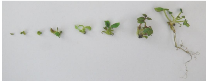
شکل ۴. مراحل رشد توت‌فرنگی رقم سلوا از مرستم تا گیاه کامل