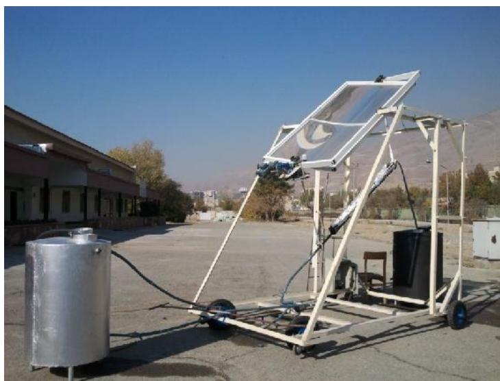
شکل ۲. متمرکزکننده خورشیدی با عدسی فرسنل خطی

که T_s^+ , T_s دماهای مخزن در یک ساعت متوالی ( ^{\circ}\text{C} )، \Delta t بازه زمانی ( h )، m جرم آب ( kg )، C_p ظرفیت گرمایی آب ( \text{kcal}/\text{kg}\cdot^{\circ}\text{C} )، Q_u آهنگ اضافه نمودن انرژی توسط متمرکزکننده ( \text{kcal}/h )، L_s آهنگ برداشت انرژی توسط مصرف کننده ( \text{kcal}/h )، U ضریب هدایت مخزن ( \text{kcal}/\text{m}^2\cdot h\cdot^{\circ}\text{C} )، A_s سطح خارجی مخزن ( \text{m}^2 ) و \Delta T = T_s - T_a اختلاف دمای محیط و داخل مخزن ذخیره آب ( ^{\circ}\text{C} ) است.