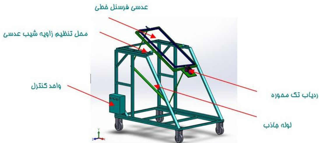
شکل ۱. طرحواره متمرکزکننده خورشیدی با عدسی فرسnel خطی

کمتري نسبت به عدسی های معمولی به کار رفته است، باریکتر و سبک تر از عدسی های معمولی است. در نتیجه، هزینه های شاسی و ردیاب در آنها کمتر است. چون توانایی جداسازی تابش های مستقیم و غیر مستقیم در آنها وجود دارد، در قیاس با عدسی های معمولی هم اندازه، دمای بیشتری ایجاد می کنند. در گذشته، ساخت این عدسی ها با دشواری همراه بود. اما امروزه با پیشرفت سامانه های ساخت رایانه ای و مواد پلیمری، ساخت این محصول آسانتر شده است و از آن در ساخت چگالنده ها (Condenser)، موازی سازها (Collimators)، نمایشگرها و ذره بین ها استفاده می گردد (۲۹). با توجه به نبود فناوری ساخت این عدسی در ایران، با سه شرکت آلمانی، ایتالیایی و چینی مذاکراتی جهت ساخت عدسی مورد نظر صورت گرفت که در نهایت شرکت چینی ChampionTechnology Co ساخت عدسی با مشخصات ذکر شده در جدول ۲ را بر عهده گرفت. پس از انتقال عدسی به ایران، برای آن شاسی مناسب طراحی و ساخته شد (شکل های ۱ و ۲).