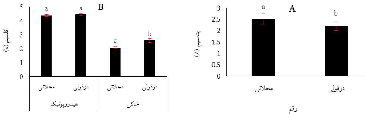
شکل ۲. تأثیر رقم بر جذب پتاسیم (A) و تغییرات جذب کلسیم (B) ارقام مختلف گل شاخه بریده مریم ( P. tuberosa L.) تحت سیستم‌های کشت خاکی و بدون خاک. حروف غیر مشابه روی هر ستون بیانگر اختلاف معنی‌دار بر اساس آزمون چنددامنه‌ای دانکن ( P \leq 0.05 ) می‌باشد

قابلیت دسترسی و حالیت این عنصر در بستر کشت، می‌تواند به دلیل بهبود وضعیت رطوبت بستر و در نتیجه افزایش جذب کلسیم در سیستم بدون خاک باشد. خلج و همکاران (۳) معتقدند که زیاد بودن ظرفیت تبادل کاتیونی در بسترهای دارای پیت، باعث افزایش ظرفیت جذب و نگهداری آب و عناصر غذایی شده و شرایط مناسب برای رشد گیاه و افزایش خصوصیات کمی و کیفی گل را در پی دارد. همچنین، خصوصیات مناسب فیزیوشیمیایی بستر موجب جذب بهتر مواد غذایی و در نتیجه کمیت و کیفیت بهتر گیاه خواهد شد (۳۱، ۳۵ و ۳۶).