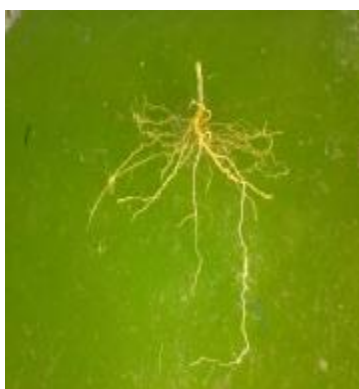
ج) آبیاری PRD بدون تیغه